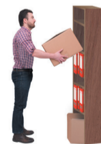
PRISE D'UN OBJET/OUTIL RANGÉ EN HAUTEUR