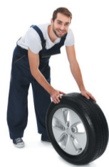
Le déplacement de pneu