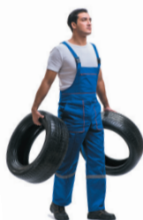
Le port de pneu