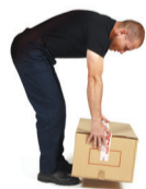
RAMASSAGE D'UN CARTON