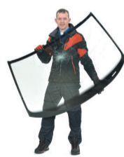
PRISE ET DÉPLACEMENT D'UN PARE-BRISE